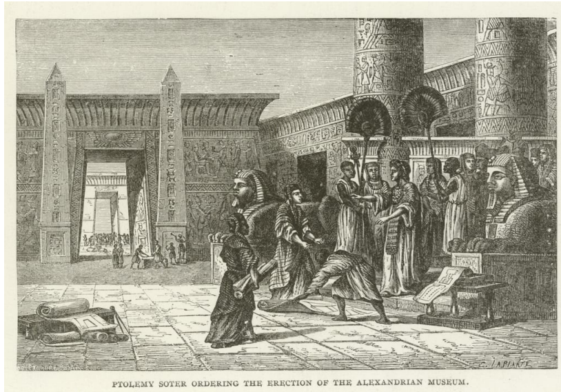
სურათი 1. პტოლემე სოტერი გასცემს ბრძანებას ააგონ ალექსანდრიის მუზეუმი