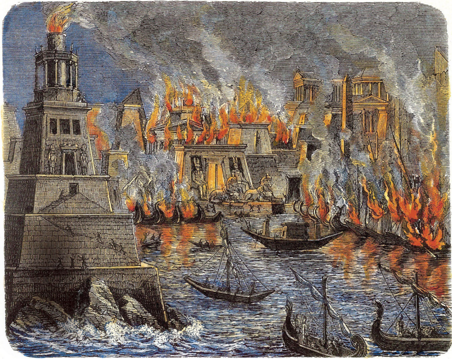
სურათი 3. ალექსანდრიის ბიბლიოთეკის დაწვა, 1876. პირადი კოლექცია. მხატვარი: ანონიმური Picture 3. The Burning of the Library of Alexandria, 1876. Private Collection. Artist: Anonymous